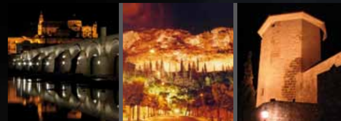
Córdoba Cabra Lucena

Las reservas se pueden realizar en los siguientes teléfonos: