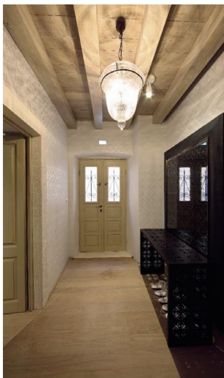
11 Tam, kde to priestor a využitie interiéru dovolili, nechali obnažené pôvodné povrchy alebo vyzdvihli zvláštnosti objavené pri archeologickom výskume.

12 Najväčší apartmán Korčula má štyri klimatizované spálne, inak sa v zrekonštruovanom paláci nachádza trinásť spální v šiestich apartmánoch. Vaňa je umiestnená v rámci dispozície spálne.