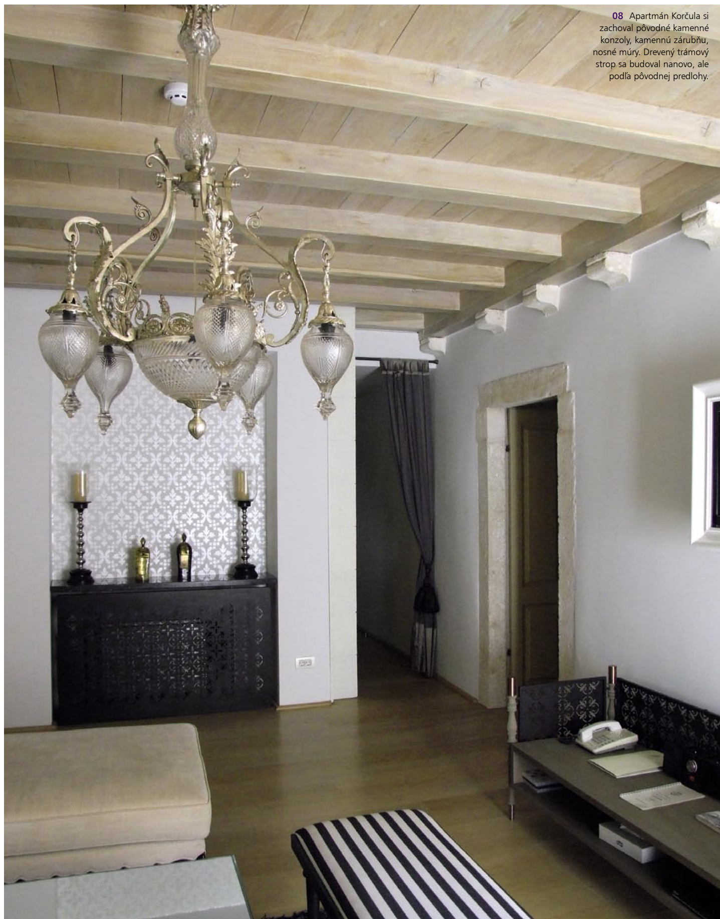
08 Apartmán Korčula si zachoval pôvodné kamenné konzoly, kamennú zárubňu, nosné múry. Drevený trámový strop sa budoval nanovo, ale podľa pôvodnej predlohy.