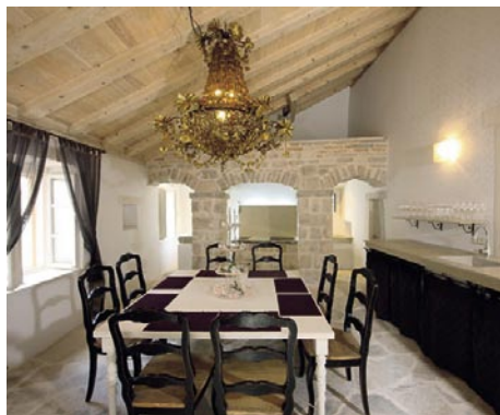
09 Štruktúra kamenného muriva a kamenárske umenie starých majstrov sú stále prítomné vo všetkých interiéroch komplexu.